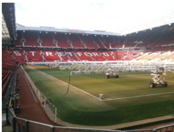
Interno del OldTrafford Stadium

Manchester è una città cosmopolita, con un atteggiamento positivo verso il futuro. Ha subito diverse trasformazioni ed è riuscita a passare dalla decadenza post-industriale al successo del recupero delle aree più depresse in un'ottica moderna. Colpisce in particolar modo il perfetto mix di antico e di moderno che caratterizza l'architettura di palazzi e monumenti. Attualmente è la capitale vivace e animata dell'Inghilterra del nord, una città moderna e vivace con oltre 2 milioni di abitanti (Greater Manchester). Abbiamo alloggiato presso l'ostello YHA Manchester , quattro stelle, in posizione centrale, molto confortevole, con un ottimo rapporto qualità/prezzo e uno staff molto cordiale e disponibile.