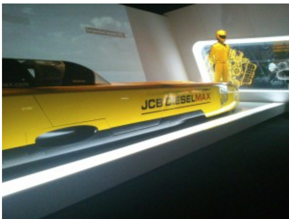
Veicolo record di JCB

costeggiano le strade principali e con una galleria al piano superiore dove si trovano negozi e attività commerciali. Ci siamo inoltre recati nella stupenda Cattedrale in arenaria rossa dell' XI secolo in stile romano e gotico. Molto bello infine anche il ponte sul fiume di Dee, costruito su sette archi nel XIII secolo. Al ritorno abbiamo dedicato il resto della giornata a visitare il centro di Manchester. La città, come già detto, offre monumenti ed edifici sia antichi che moderni. Poco lontano dal nostro ostello c'è la Beetham Tower, un grattacielo dalla struttura azzardata che ospita anche l'Hotel Hilton. Ai Piccadilly Gardens si trova la Manchester Wheel, che richiama la più famosa ruota panoramica del London Eye. Sorprendente si è rivelata la visita alla Cattedrale gotica del XV secolo, famosa in tutta la Gran Bretagna per la sua perfezione ed armonia architettonica. E' davvero imponente, sia fuori che all'interno.