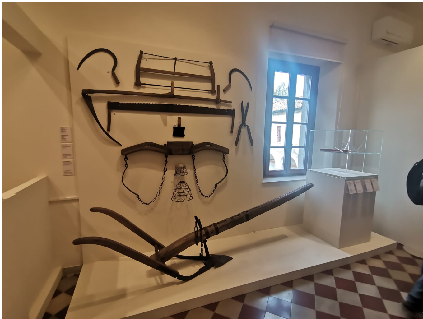
Strumenti di lavoro dei frati benedettini per arare i campi dell'abbazia