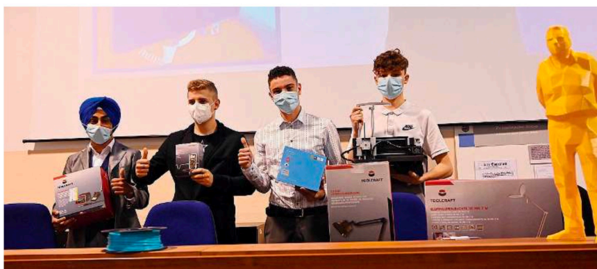
Tecno Elite. I ragazzi che hanno vinto la seconda edizione dell'hackathon organizzato dal GdB con The FabLab e Talent Garden