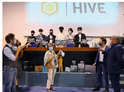
Hive. I secondi classificati sul palco della premiazione