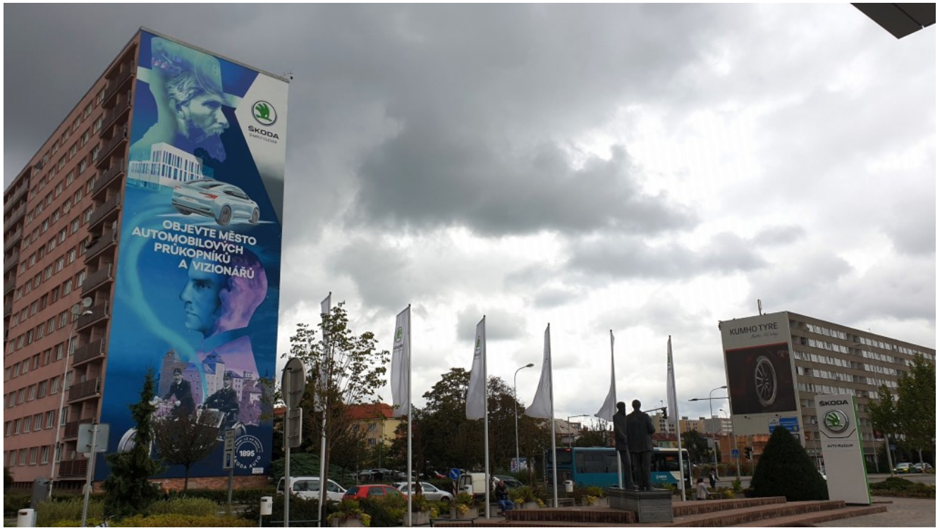
Entrata del museo di Skoda Auto