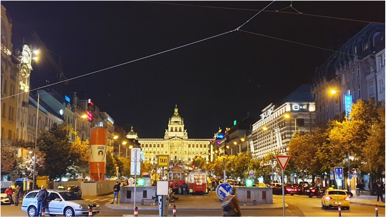
Piazza San Venceslao

È stato un viaggio indimenticabile, dove tutto è stato organizzato nei minimi dettagli, dal volo in aereo all'alloggio in hotel.