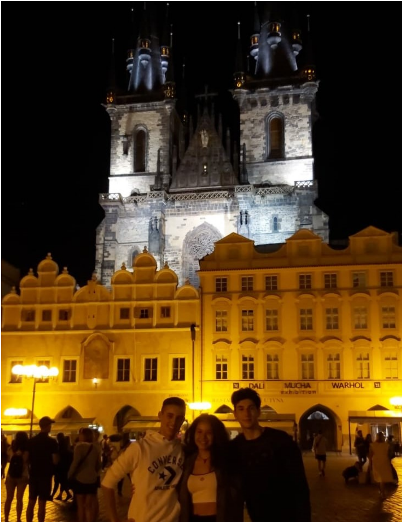
Piazza della Città Vecchia