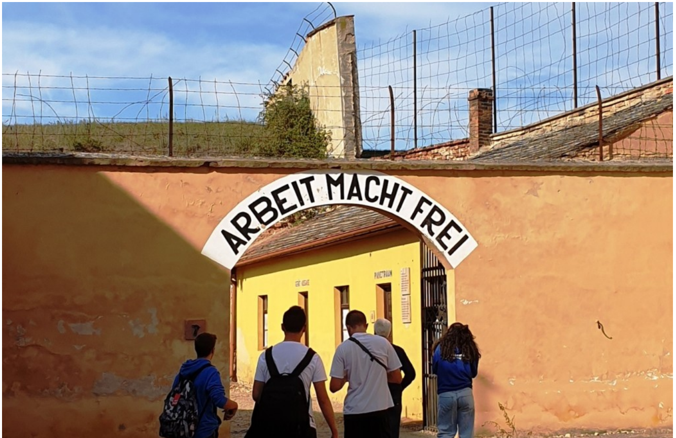
Entrata del campo di concentramento di Terezin

Inoltre sono state organizzate numerose visite in città, come alla National Gallery, all'interno dell'orologio astronomico e per finire una crociera sul fiume Moldava, attraverso il centro di Praga.