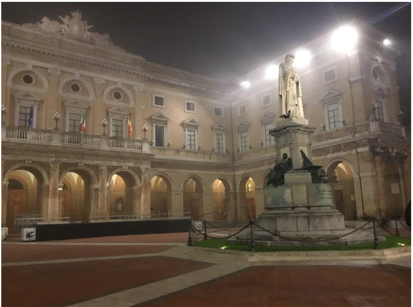
Statua di Giacomo Leopardi nella piazza principale di Recanati

La figura designata quest'anno dal concorso è Giacomo Leopardi: poeta e filosofo ottocentesco. Per l'occasione, i 10 studenti selezionati hanno intrapreso un percorso di esperienze formative, finanziate dalla scuola, al fine di conoscere e approfondire la vita e il pensiero del letterato marchigiano. La prima tra queste esperienze è stata la visita a Recanati, città natale di Leopardi, dove gli studenti hanno ripercorso i primi passi del poeta nella sua residenza familiare e nella sua vita quotidiana giovanile; dei carteggi originali leopardiani, solo una parte è presente a Recanati.