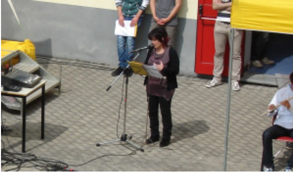
Intervento prof.ssa Trane

Quando la morte genera nella testa di un essere umano infiniti e assillanti e devastanti «perché», quando con il suo sguardo assente e i suoi denti impudici sorveglia gioiosa gli ultimi istanti di una «giovane vita», quando in quei terribili istanti il suo velo opprimente soffoca chi se ne va e chi rimane su questo angolo d'universo disorientandolo e stroncando ogni sottilissima sicurezza, risuonano sfolgoranti parole partorite alla ricerca di una sola risposta. Dopo estenuanti attese alla ricerca anche di quella sola risposta ai miei infiniti perché, ho urlato al mio cuore, affinché si incastonassero per sempre, queste parole: «Gli angeli camminano sulla Terra solo per poco, hanno la purezza per affrontare il Grande Volo. Nascondono piccole ali luminose invisibili all'occhio umano. Li vedi ma spesso non li riconosci perché non li guardi negli occhi. Sono passeggeri consolatori nell'inverno delle stagioni. Filtrano il Bene lasciando incenerire il Male. Così la Terra con loro è un Paradiso fatto di mortali. A volte succede che diventano Angeli con grandi ali per amarci eternamente...». Ogni volta che conosco storie di giovani volati via troppo presto, alimento la presunzione di comprendere l'angoscia e l'incredulità delle famiglie perché rivivo, secondo per secondo, il mio dramma e quello della mia famiglia per il nostro bel Gianluca. Come in