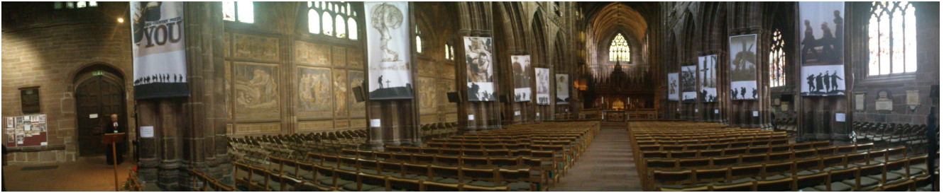
Panoramica della Cattedrale di Chester

a benzina), sullo sviluppo del sistema fognario della città e sui settori tessile, delle comunicazioni e dell'informatica.