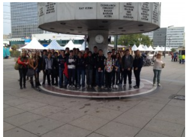
I ragazzi ad Alexanderplatz

Io la mia prima esperienza l'ho fatta in 3° superiore con la mia classe.