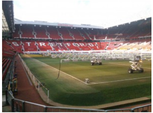
Interno del OldTrafford Stadium