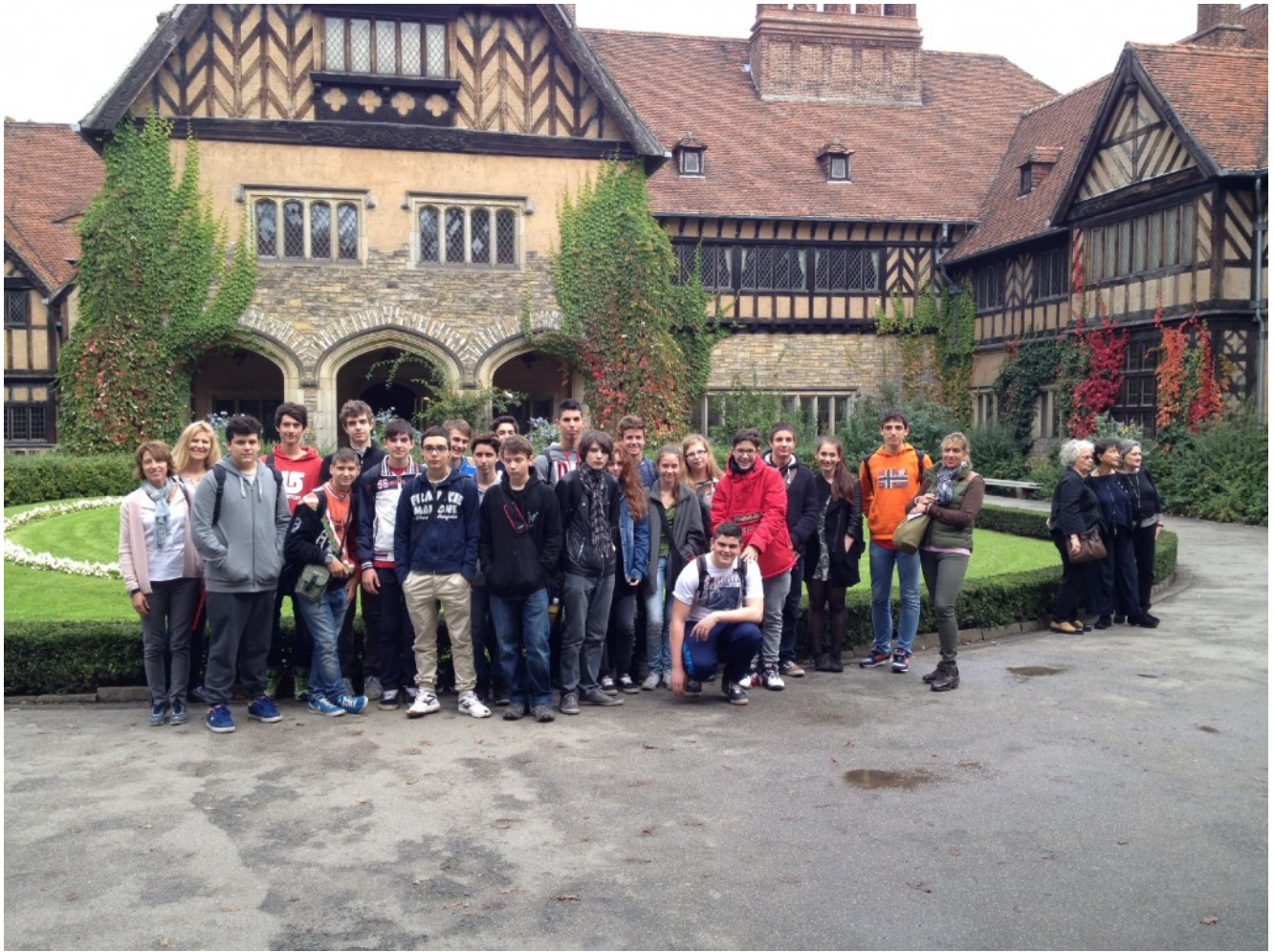
I ragazzi a Cecilienhof