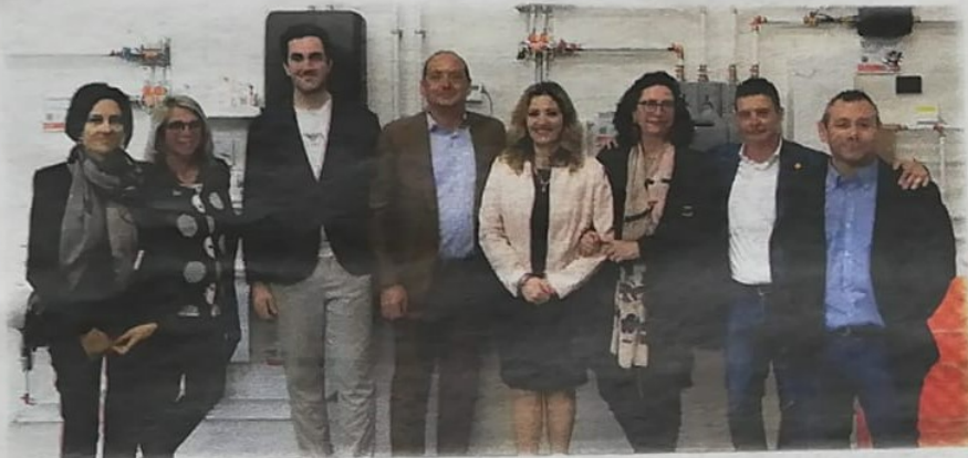
L'inaugurazione del nuovo laboratorio al 'Cerebotani' di Lonato del Garda

L'Istituto superiore statale Cerebotani si dota di nuove strumentazioni all'avanguardia. E' arrivato infatti, all'Itis di Lonato del Garda, un laboratorio didattico a uso degli studenti dell'istituto superiore e attrezzato con materiali di ultima generazione per lo studio e il funzionamento dell'energia utilizzata negli impianti di riscaldamento