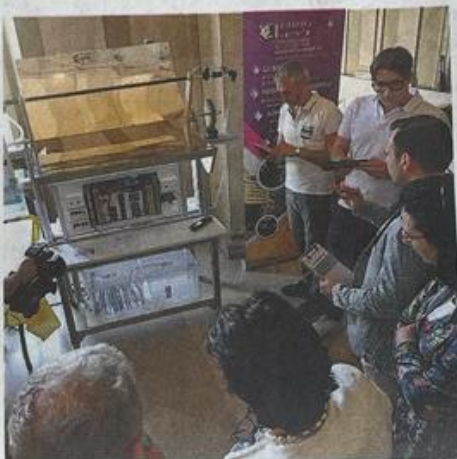
Secondo posto. Lo «specchio d'acqua» Wa.Mi del Primo Levi

com SmartPad iYo 104G forniti da Giustacchini Printing -, è stato ideato per mitigare una problematica sanitaria che interessa principalmente i Paesi in via di sviluppo». Wa.Mi è costituito da un telaio in alluminio alla cui sommità è incernierato uno specchio parabolico a inseguimento solare: la radiazione captata viene riflessa su un collettore cilindrico contenente H 2 O, portata a una temperatura utile per la pastorizzazione (56-72°C): a questo pun-