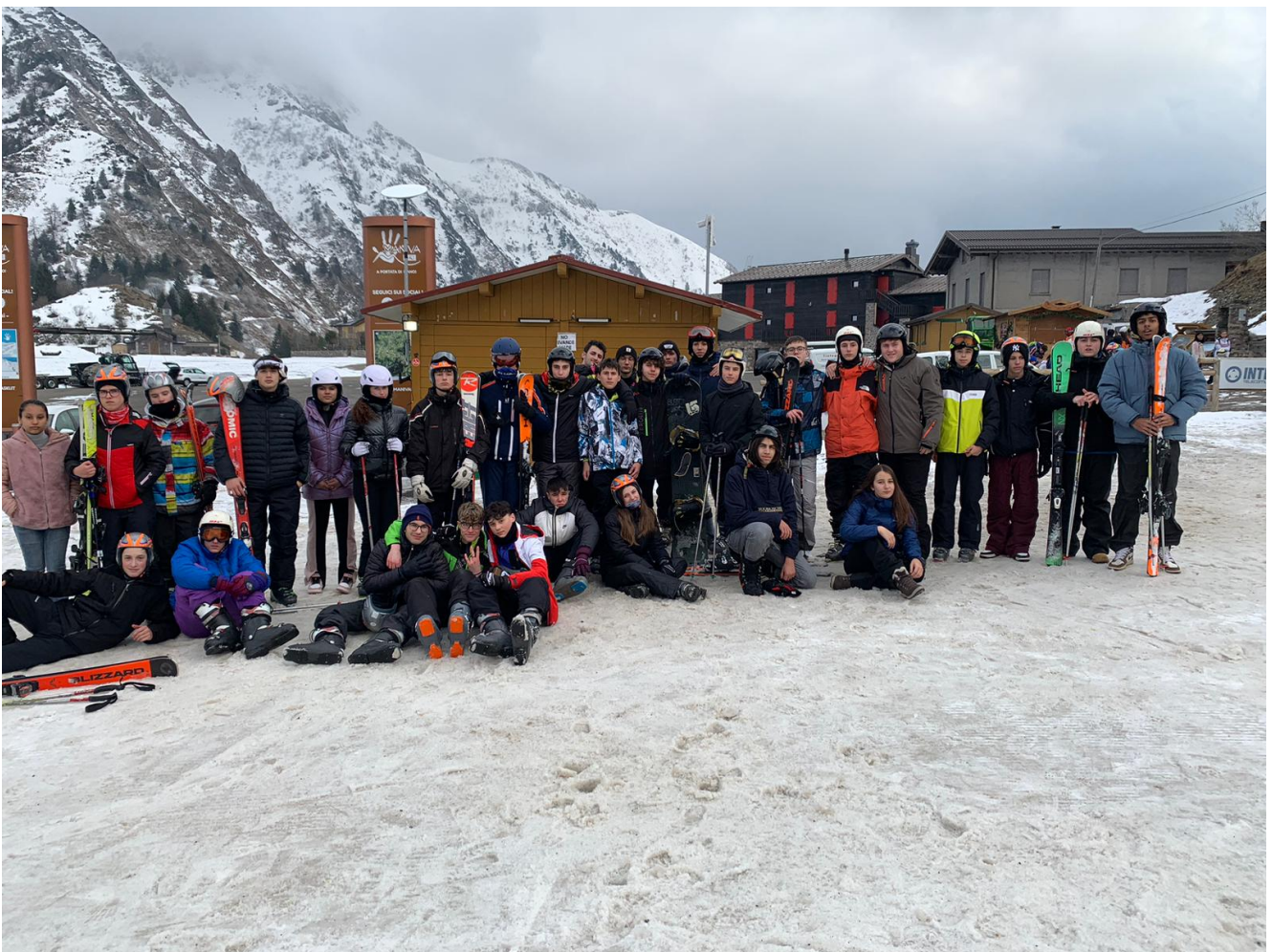
Classi martedì 07/03/2023