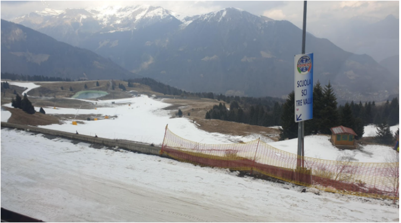
Classi lunedì 06/03/2023