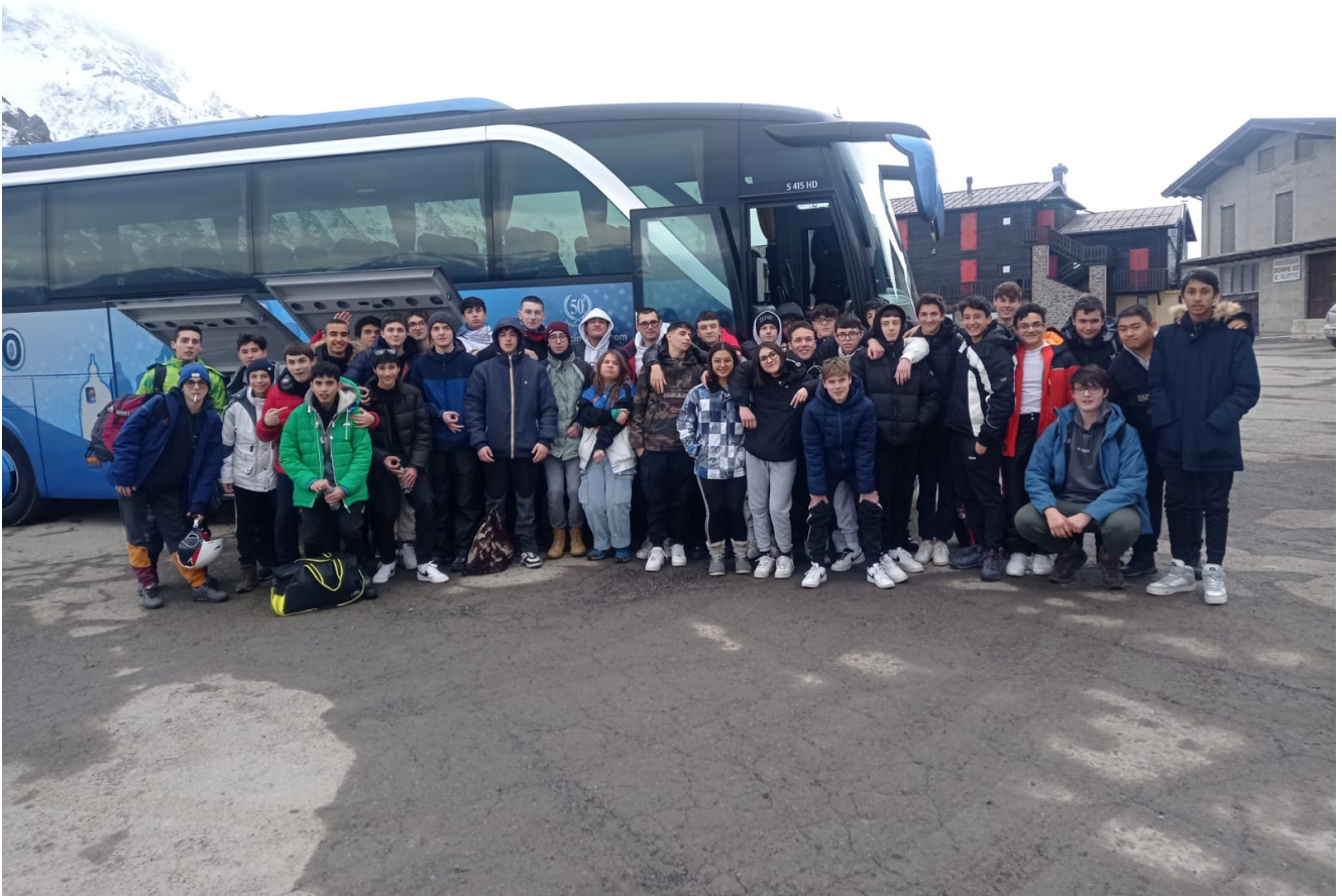
Classi venerdì 10/03/2023