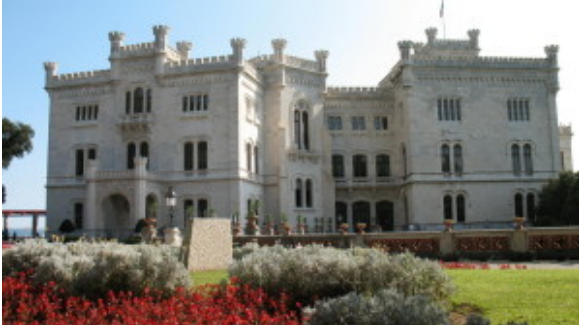
Trieste-Castello di Miramare

E' tra le lacrime dei professori affranti per la partenza dei loro alunni preferiti che la classe 3F, mercoledì 12 marzo 2014, ha lasciato la stazione ferroviaria di Desenzano alla volta del Friuli Venezia Giulia.