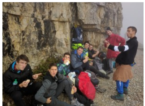
Percorso delle 52 gallerie

Sono ormai immagini lontane quelle di eroi che la storia l'han fatta, che la storia l'han subita sulla loro pelle, che hanno dato la loro vita per seguire un ideale, ed è triste pensare che la società di oggi, non abbia né il tempo, né la voglia di fermarsi a ricordare. Il 24 ottobre, ho avuto l'opportunità di partecipare ad una passeggiata in questa storia, una gita lungo le strade ed i luoghi del Pasubio, spoglio teatro di antiche atrocità, sacrifici e privazioni. Il mio non vuole essere uno scritto su cosa abbiamo fatto, ma un documento che provi a descrivere le emozioni, davvero forti che abbiamo vissuto.