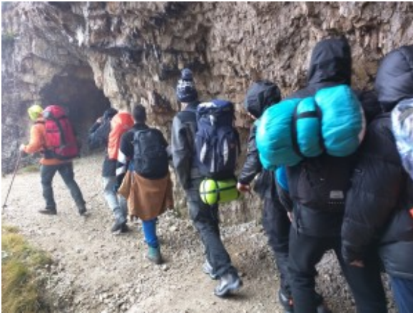
Percorso delle 52 gallerie

Sono ormai immagini lontane quelle di eroi che la storia l'han fatta, che la storia l'han subita sulla loro pelle, che hanno dato la loro vita per seguire un ideale, ed è triste pensare che la società di oggi, non abbia né il tempo, né la voglia di fermarsi a ricordare. Il 24 ottobre, ho avuto l'opportunità di partecipare ad una passeggiata in questa storia, una gita lungo le strade ed i luoghi del Pasubio, spoglio teatro di antiche atrocità, sacrifici e privazioni. Il mio non vuole essere uno scritto su cosa abbiamo fatto, ma un documento che provi a descrivere le emozioni, davvero forti che abbiamo vissuto.