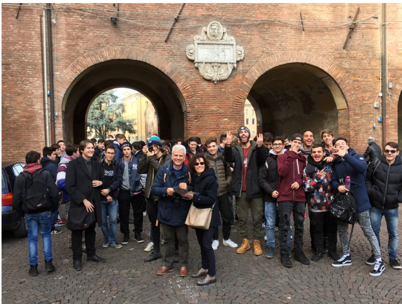
Foto di gruppo durante la visita della città