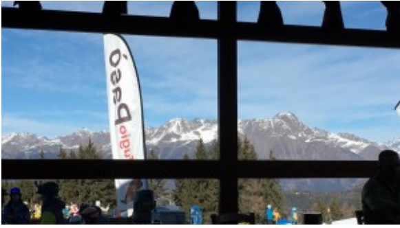
vista dal rifugio Pasò

Successivamente ci si reca in albergo per potersi riposare dopo la faticosa giornata e, terminata la cena, tutti quelli che volevano hanno avuto la possibilità di fare un giro per il paese fino alle 22.30. I giorni seguenti la colazione era prevista per le 7.30 in albergo e appuntamento alle 9.00 con i maestri sulle piste fino alle 11.00 per poi poter pranzare al rifugio e avere libertà fino alla chiusura degli impianti, avendo la possibilità di scegliere se sciare, stare in albergo oppure fare una nuotata alle piscine comunali. La sera dopo la cena, come il primo giorno si aveva la possibilità di stare in albergo oppure fare un giretto per il paese fermandosi in dei bar o pub.