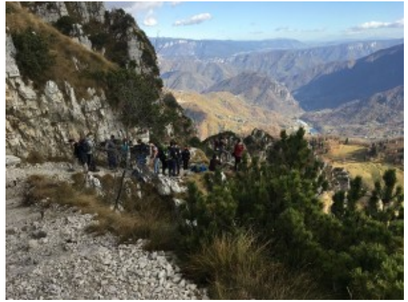
Camminata nelle Prealpi Venete

I ragazzi che sono partiti avevano solo una scelta: morire o vivere uccidendo con la consolazione di averlo fatto per difendere donne e bambini dall'invasore.