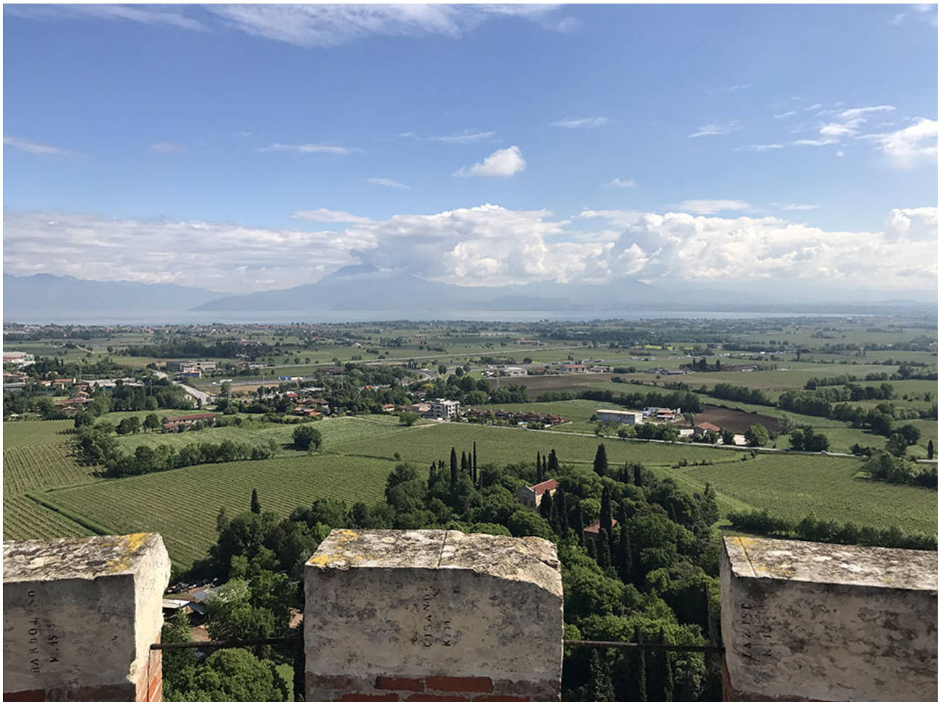
Visuale dalla Torre di San Martino