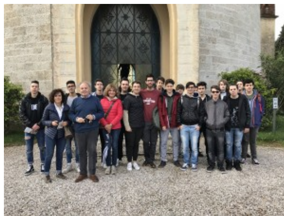
Classe 4°E presso la Torre di San Martino

Martedì 9 Maggio la nostra classe, 4e dell'Itis di Lonato, è andata a San Martino della Battaglia per approfondire la seconda guerra d'indipendenza dove le forze del Regno Sabauda,