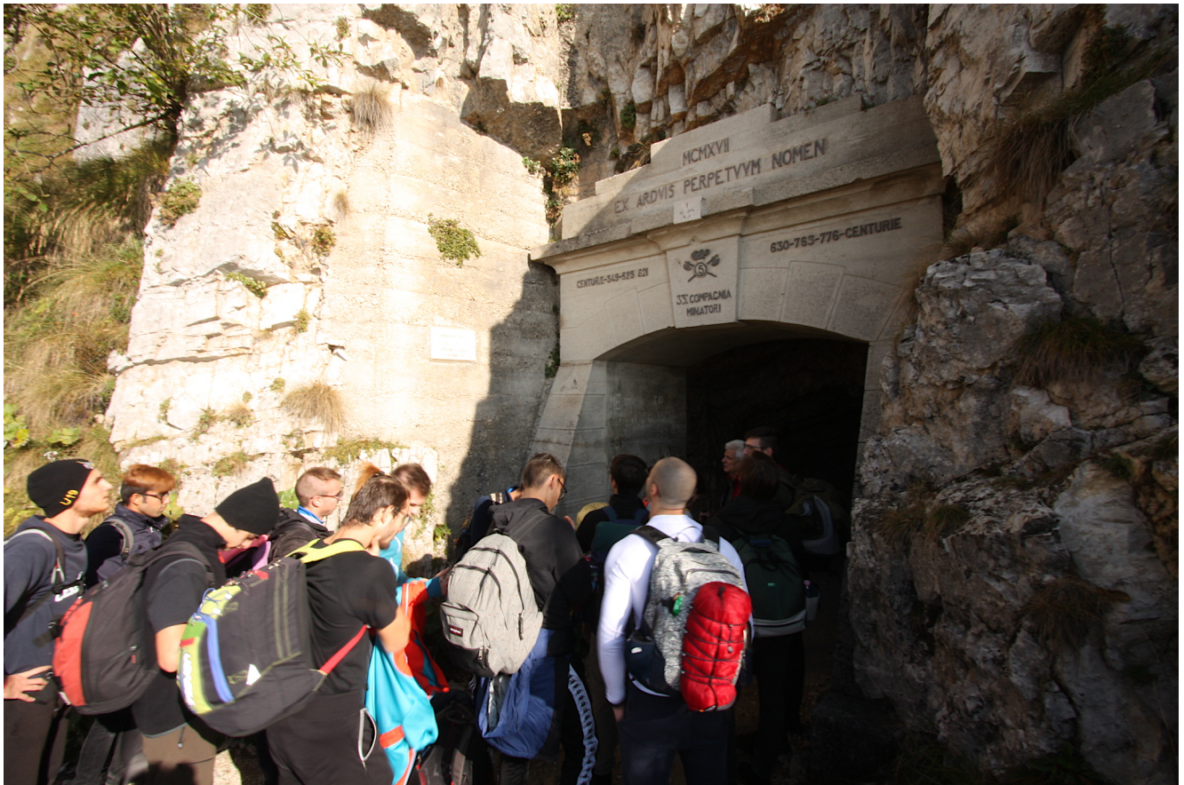
Ingresso della prima delle 52 gallerie