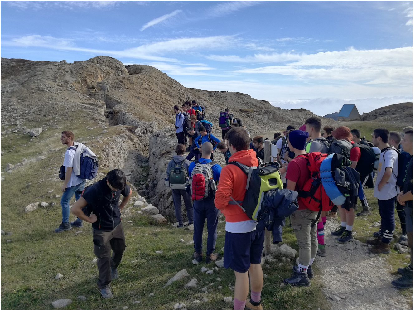
I resti della trincea lungo il fronte