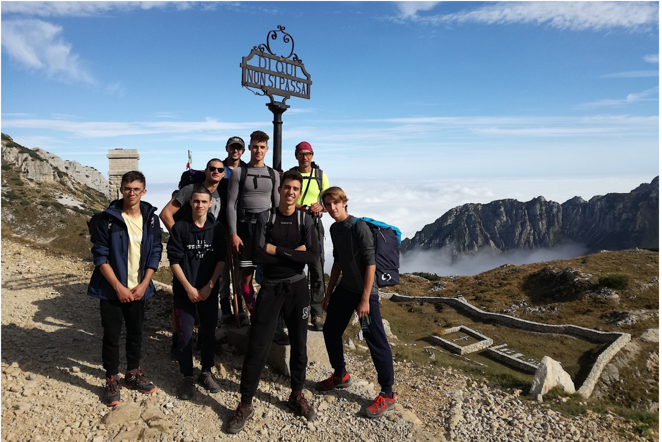
Il panorama in prossimità della "Selletta di Comando"