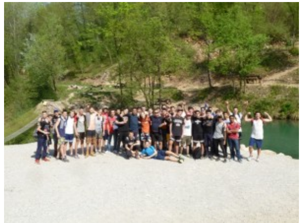
Foto di gruppo dei partecipanti

In data 26/04/2018 ci siamo recati a Casto al “parco delle fucine” per una giornata all’insegna dell’avventura e del divertimento.