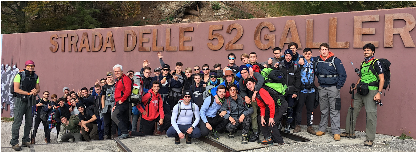
Il gruppo alla partenza

Il 14 e il 15 ottobre 2019, una cinquantina di studenti appartenenti alle classi 5 a B, 5 a C e 5 a M, accompagnati dai docenti Ardesi, Guerra, Masetti e capitanati dal prof. Bandera, hanno affrontato l'impegnativa ma entusiasmante escursione sul Monte Pasubio, là dove durante la Grande Guerra era il fronte con l'Austria. Partiti dalla sede del nostro Istituto la mattina del 14 ottobre, con qualche problema dovuto alla lentezza dell'autobus, si raggiunge prima Schio e poi Valli del Pasubio, quindi si cambia mezzo con un paio di navette da 20 posti in località Ponte Verde per arrivare a Bocchette di Campiglia, dove inizia il trekking con la "Strada delle 52 gallerie".