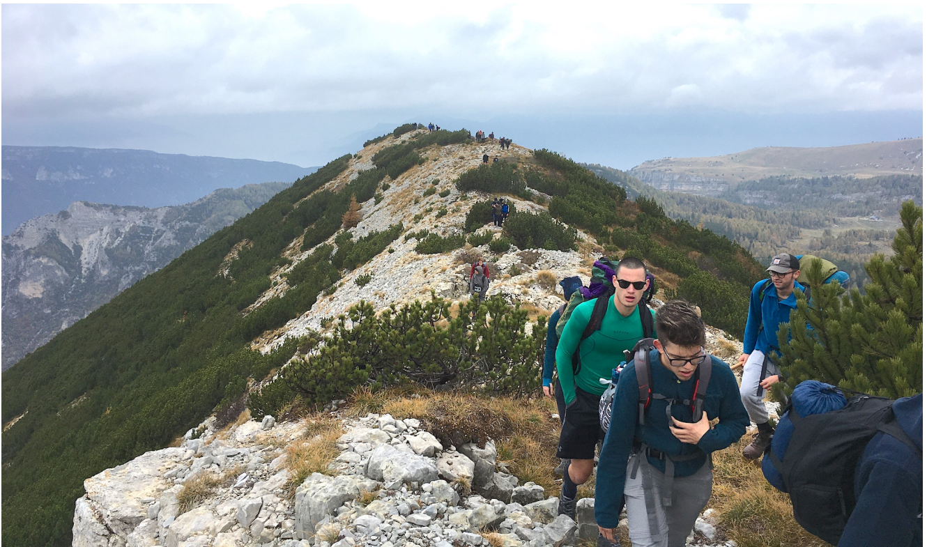
Il percorso in cresta sul Monte Roite

Il giorno successivo si riparte per il percorso di ritorno, di nuovo verso il rifugio Papa, ma questa volta sulla cresta del Monte Pasubio. Il tempo non è bello come il giorno precedente: una pioggerella fina, spinta da venti freddi che salgono il fronte sud della montagna e una nebbia a volte insistente ci accompagnano lungo tutto il percorso di 8 km fino al rifugio Papa. Raggiunta “Bocchetta delle Corde” a 1900 mslm, si inizia a salire sul Monte Roite (2144 mslm) per percorrerne la cresta e la trincea che la delinea in un trekking di saliscendi fino al “Dente Austriaco” (2203 mslm) e al “Dente Italiano” (2220 mslm). Entrati nella galleria “Achille Papa”, ormai in territorio Italiano, si sbuca proprio sulla cima Palon a quota 2232 mslm.