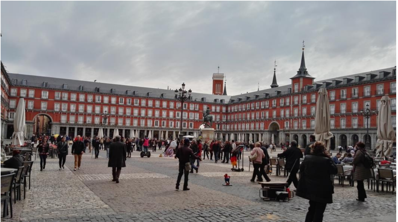
Plaza Mayor vista dall'interno