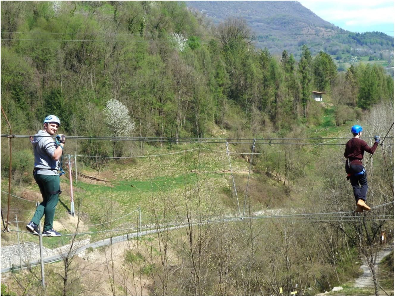
Il ponte tibetano a tre funi