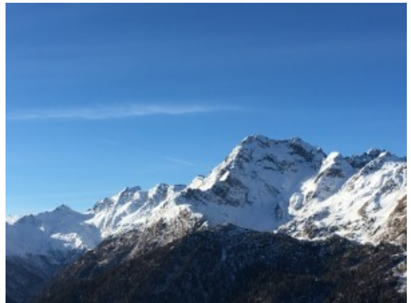
il panorama innevato

Successivamente ci si reca in albergo per potersi riposare dopo la faticosa giornata e, terminata la cena, tutti quelli che volevano hanno avuto la possibilità di fare un giro per il paese fino alle 22.30. I giorni seguenti la colazione era prevista per le 7.30 in albergo e appuntamento alle 9.00 con i maestri sulle piste fino alle 11.00 per poi poter pranzare al rifugio e avere libertà fino alla chiusura degli impianti, avendo la possibilità di scegliere se sciare, stare in albergo oppure fare una nuotata alle piscine comunali. La sera dopo la cena, come il primo giorno si aveva la possibilità di stare in albergo oppure fare un giretto per il paese fermandosi in dei bar o pub.