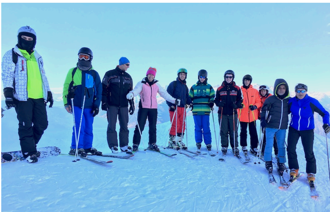
Un gruppetto di noi a quota 2334 m.s.l.