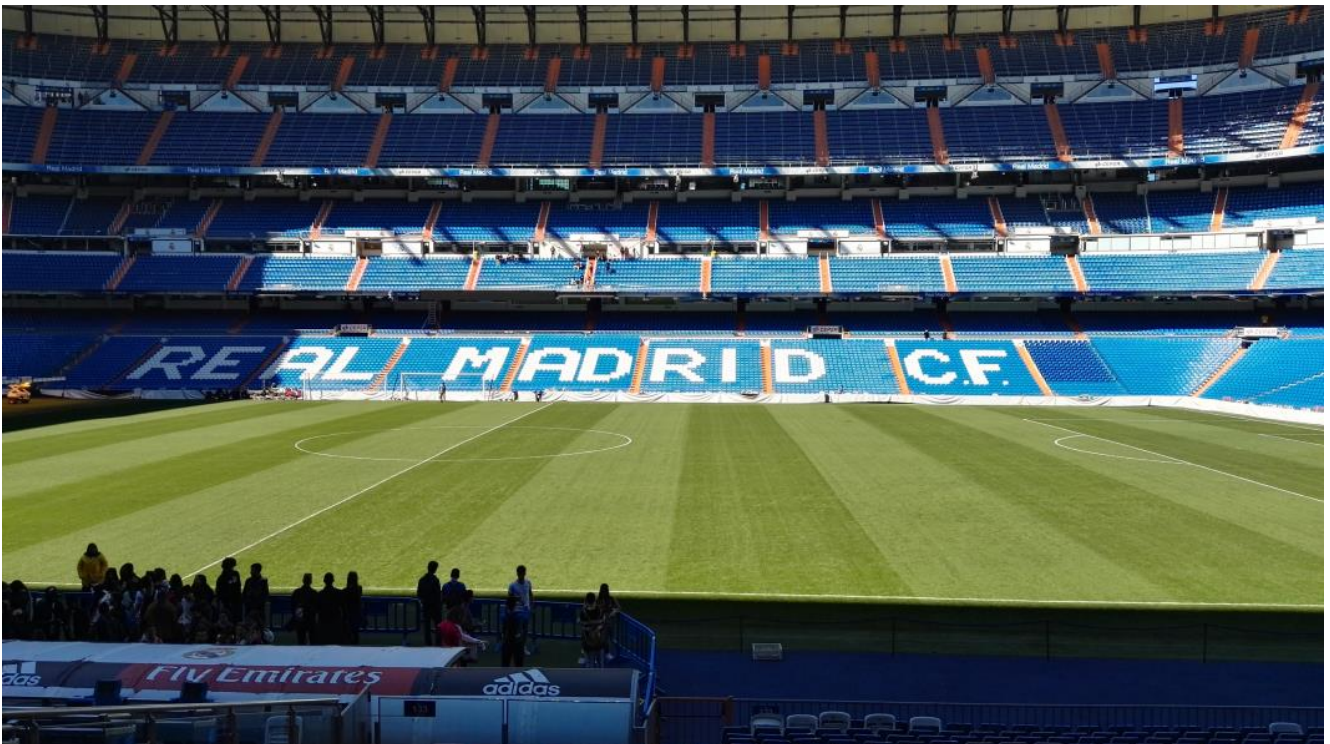
Lo stadio "Santiago Bernabeu", del Real Madrid, visto dalla tribuna