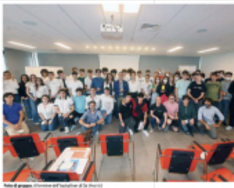
Una delle squadre vincitrici, i ragazzi del Muschio di Sarnonno.