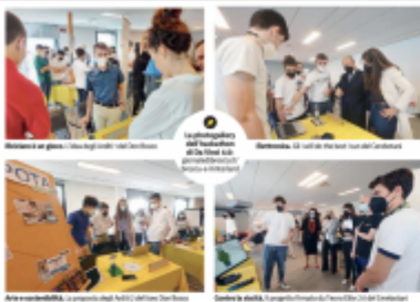
Alcune immagini della competizione. In alto: i ragazzi del Cerebotani di Lonato che hanno vinto il premio. In basso: i ragazzi del Muschio di Sarnonno che hanno vinto il premio.