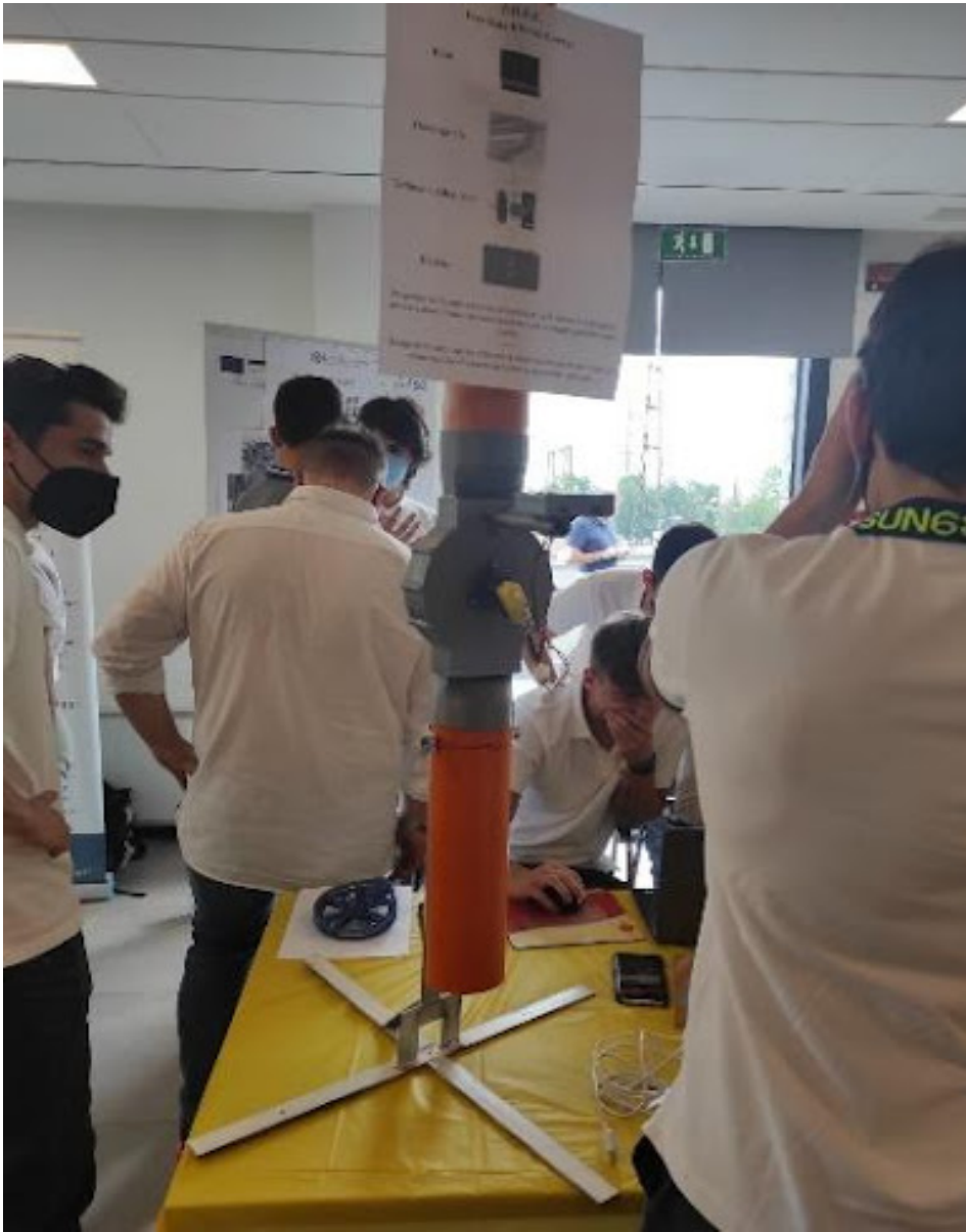
Techno elite 2.0