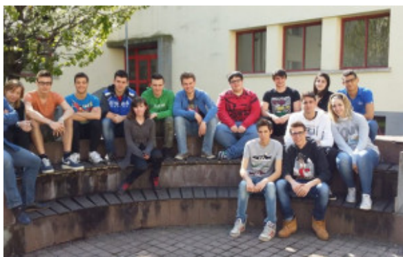
Gruppo Peer Education

Nell'anno scolastico 2012/2013, all'I.I.S Luigi Cerebotani di Lonato del Garda, è partito il progetto "Peer Education". Il progetto consiste nella educazione dei ragazzi e delle ragazze