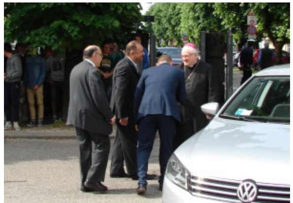
L'arrivo del Vescovo

Rivendico a questa scuola un valore strategico, rivendico il possesso di giacimenti di competenze e conoscenze che le consentono, pur essendo una scuola di periferia , di non essere da meno rispetto alle scuole di Brescia e provincia dotate anch'esse, di lunga tradizione, storia, elevate competenze tecniche e scientifiche.