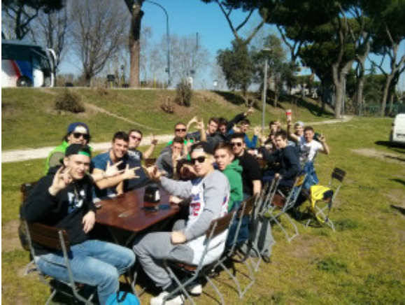
Gita Roma 4c

Il viaggio non è stato lungo poiché avendo acquistato i biglietti per il treno “freccia argento” abbiamo evitato di perdere mezza giornata di gita sui mezzi.