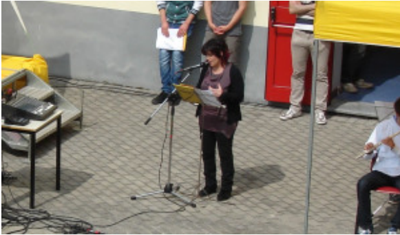
Intervento prof.ssa Trane

Quando la morte genera nella testa di un essere umano infiniti e assillanti e devastanti «perché», quando con il suo sguardo assente e i suoi denti impudici sorveglia gioiosa gli ultimi istanti di una «giovane vita», quando in quei terribili istanti il suo velo opprimente soffoca chi se ne va e chi rimane su questo angolo d'universo disorientandolo e stroncando ogni sottilissima sicurezza, risuonano sfolgoranti parole partorite alla ricerca di una sola risposta. Dopo estenuanti attese alla ricerca anche di quella sola risposta ai miei infiniti perché, ho urlato al mio cuore, affinché si incastonassero per sempre, queste parole: «Gli angeli camminano sulla Terra solo per poco, hanno la purezza per affrontare il Grande Volo. Nascondono piccole ali luminose invisibili all'occhio umano. Li vedi ma spesso non li riconosci perché non li guardi negli occhi. Sono passeggeri consolatori nell'inverno delle stagioni. Filtrano il Bene lasciando incenerire il Male. Così la Terra con loro è un Paradiso fatto di mortali. A volte succede che diventano Angeli con grandi ali per amarci eternamente...». Ogni volta che conosco storie di giovani volati via troppo presto, alimento