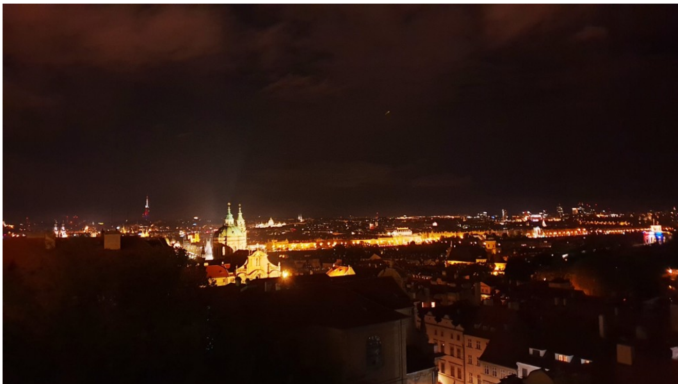
Vista della città dal Castello di Praga

dell'Industria 4.0, con finanziamenti dell'Unione Europea. Tramite un'agenzia locale, ad ogni ragazzo è stata assegnata un'azienda che opera in un settore inerente l'indirizzo di studio dello studente: informatica, elettronica, meccanica e chimica.