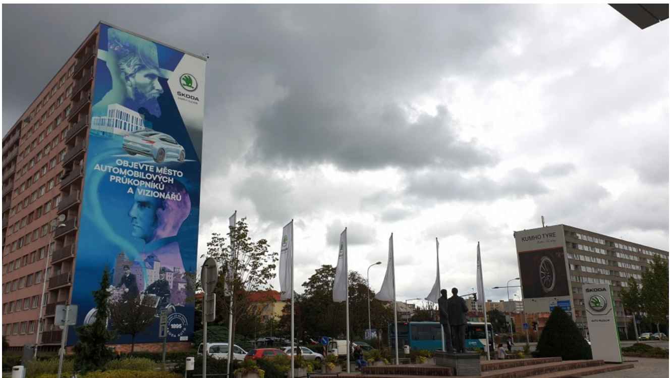
Entrata del museo di Skoda Auto

Non è da dimenticare una visita molto significativa, quella alla Skoda Auto, azienda automobilistica leader in Repubblica Ceca. Abbiamo avuto la possibilità di osservare le catene di montaggio di Skoda Fabia e Octavia in funzione, accompagnati da guide esperte che hanno spiegato ogni minimo dettaglio. In questa azienda, una delle più significative in Repubblica Ceca, gli alunni hanno potuto riconoscere una possibile loro figura lavorativa in futuro, che gli spinge ulteriormente a impegnarsi nello studio e formazione.