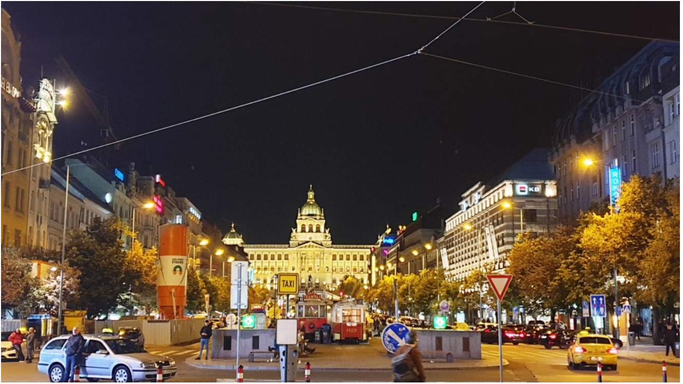
Piazza San Venceslao

È stato un viaggio indimenticabile, dove tutto è stato organizzato nei minimi dettagli, dal volo in aereo all'alloggio in hotel.