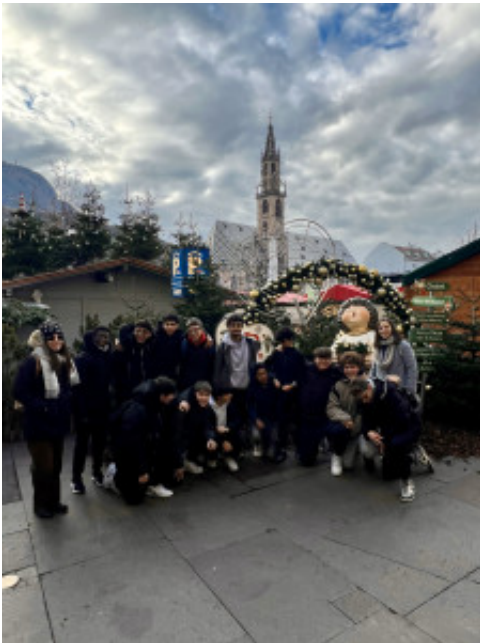
La classe 1 I in gita