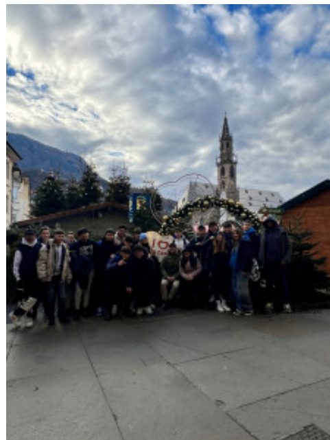
La classe 1 A in gita