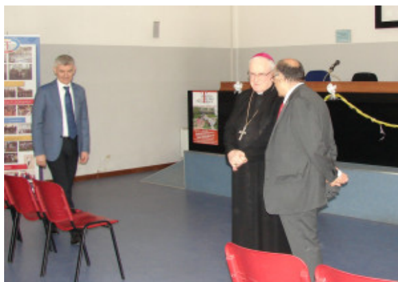
In aula magna con il Sindaco

che la nostra scuola formi dei tecnici di valore è inevitabile che siamo investiti dall'onda d'urto della crisi economica. Noi avvertiamo il disagio delle famiglie e tocchiamo con mano