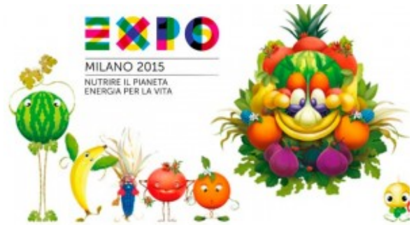
Logo dell' Expo 2015

Dal 1 maggio al 31 ottobre 2015, 184 giorni di evento, oltre 130 Stati partecipanti.