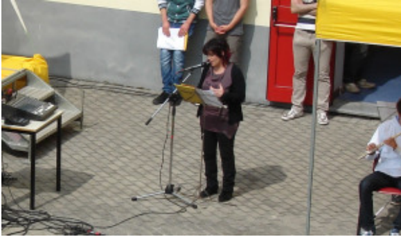
Intervento prof.ssa Trane

Quando la morte genera nella testa di un essere umano infiniti e assillanti e devastanti «perché», quando con il suo sguardo assente e i suoi denti impudici sorveglia gioiosa gli ultimi istanti di una «giovane vita», quando in quei terribili istanti il suo velo opprimente soffoca chi se ne va e chi rimane su questo angolo d'universo disorientandolo e stroncando ogni sottilissima sicurezza, risuonano sfolgoranti parole partorite alla ricerca di una sola risposta. Dopo estenuanti attese alla ricerca anche di quella sola risposta ai miei infiniti perché, ho urlato al mio cuore, affinché si incastonassero per sempre, queste parole: «Gli angeli camminano sulla Terra solo per poco, hanno la purezza per affrontare il Grande Volo. Nascondono piccole ali luminose invisibili all'occhio umano. Li vedi ma spesso non li riconosci perché non li guardi negli occhi. Sono passeggeri consolatori nell'inverno delle stagioni. Filtrano il Bene lasciando incenerire il Male. Così la Terra con loro è un Paradiso fatto di mortali. A volte succede che diventano Angeli con grandi ali per amarci eternamente...». Ogni volta che conosco storie di giovani volati via troppo presto, alimento la presunzione di comprendere l'angoscia e l'incredulità delle famiglie perché rivivo, secondo per secondo, il mio dramma e quello della mia famiglia per il nostro bel Gianluca. Come in tutte le cose della vita... solo chi sperimenta sulla propria pelle può capire. Intorno, quando la sensibilità è un dono