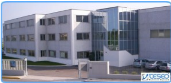
Sede principale di Desenzano

C'è da dire che nonostante tutto il giro di affare sia italiano sia internazionale, questa è una piccola-media azienda che vanta l'operato di 50 persone tra operai e dirigenti. Ma non solo, dai grafici mostrati all'arrivo, si è notato che comunque in relazione alle proprie dimensioni l'azienda ha sempre avuto dei buoni profitti e una sostanziale crescita. Concludo affermando che, da un'idea che può sembrare banale come quella della sostituzione dei tubi di ferro (pesanti, difficili da montare) a quelli di alluminio (leggermente un po' più costosi ma più efficienti, maneggevoli, resistenti) si è riusciti a tirar su un'azienda che occupa un posto ben piazzato nel suo settore. (Chiaramente non è stato solo quello a dare il boom ma anche un susseguirsi di raffinatezze tecniche ed e nuovi brevetti come il carrello che trasporta l'uscita dell'aria compressa oppure le pale eoliche che possono fungere da compressori, etc.)