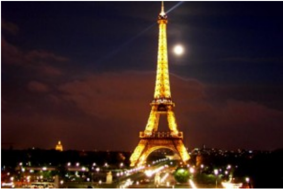
La tour Eiffel di notte

Tantissime sono le Esposizioni Universali che si sono susseguite dal 1933 ad oggi, ma alcune di esse, anche antecedenti a questa data, sono passate alla storia.