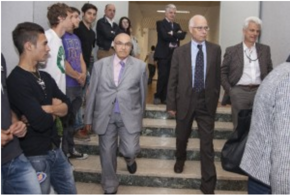
Ingresso in Aula Magna