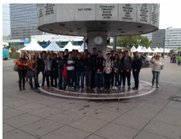
I ragazzi ad Alexanderplatz

Io la mia prima esperienza l'ho fatta in 3° superiore con la mia classe.