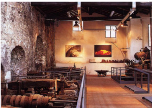
Museo del Ferro

Era un giovedì mattina, come gli tutti altri, quando durante l'ora di Sistemi il preside è entrato in classe dandoci un avviso. Esso riguardava una gita offerta dall'Associazione Imprenditori Bresciani, insieme alla classe 4 G , prima a Odolo (dove è situato il Museo del ferro) poi in Feralpi. Presi dall'entusiasmo le ore seguenti non ascoltammo le lezioni pensando solo alla gita e a quanto ci saremmo divertiti.