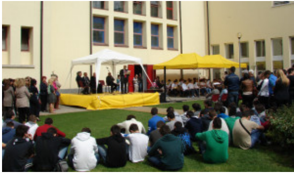
La festa in cortile

Nello stesso tempo abbiamo potenziato il settore linguistico con