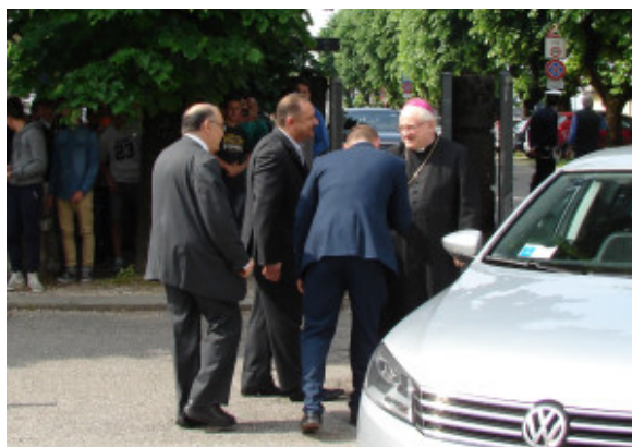
L'arrivo del Vescovo

giacimenti di competenze e conoscenze che le consentono, pur essendo una scuola di periferia , di non essere da meno rispetto alle scuole di Brescia e provincia dotate anch'esse, di lunga tradizione, storia, elevate competenze tecniche e scientifiche.