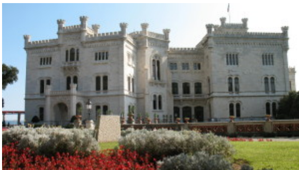
Trieste-Castello di Miramare

E' tra le lacrime dei professori affranti per la partenza dei loro alunni preferiti che la classe 3F, mercoledì 12 marzo 2014, ha lasciato la stazione ferroviaria di Desenzano alla volta del Friuli Venezia Giulia.