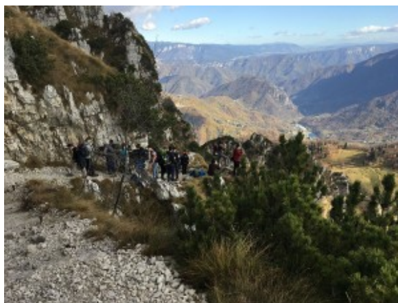
Camminata nelle Prealpi Venete

Si combatteva come topi, sotto terra, con la speranza di tornare dai propri cari, non più corpo a corpo, non più con la spada o con il cavallo. Si veniva uccisi da proiettili vaganti sparati da persone senza un volto soltanto perché visti dalla parte opposta del campo. I giovani sono idealisti per definizione, non hanno paura del sacrificio se ne vale la pena. Chi pensa che un conflitto sia il modo migliore per impiegarli é un cinico, perché esso non offre ideali ma soltanto morte.