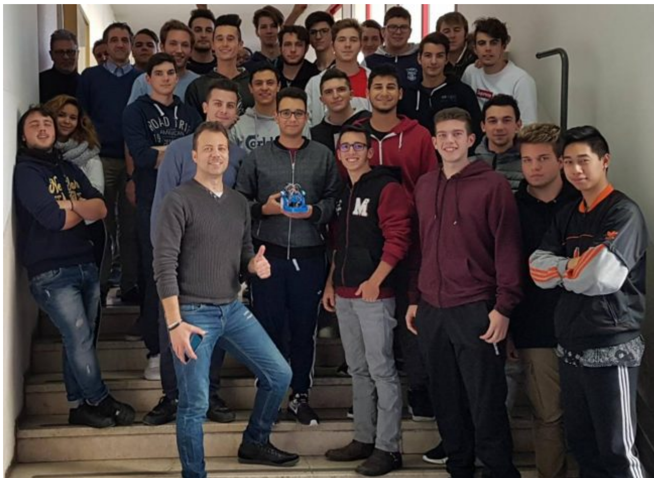
Il gruppo vincente