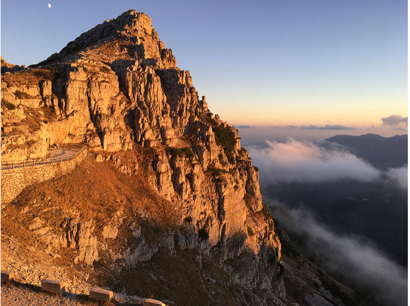
Panorama dal Rifugio Achille Papa