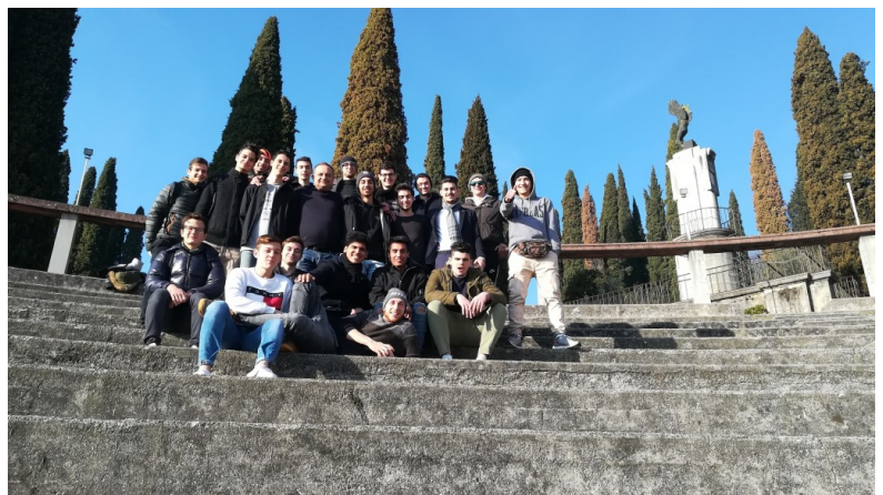
Gli studenti della classe 5^A

L'opulenza con cui il celebre poeta ha vissuto la sua intensa vita, si rispecchia nella smisurata ricchezza di particolari e dettagli che ha voluto inserire nella sua casa e nel suo parco, che ancora a distanza di decenni dalla sua scomparsa, riescono ad affascinare ed incantare chiunque. La visita guidata nelle camere di d'Annunzio la fortuna di aver trovato una splendida giornata hanno migliorato ancor di più l'esperienza, che si è rivelata una delle uscite più belle e divertenti di questi cinque anni.