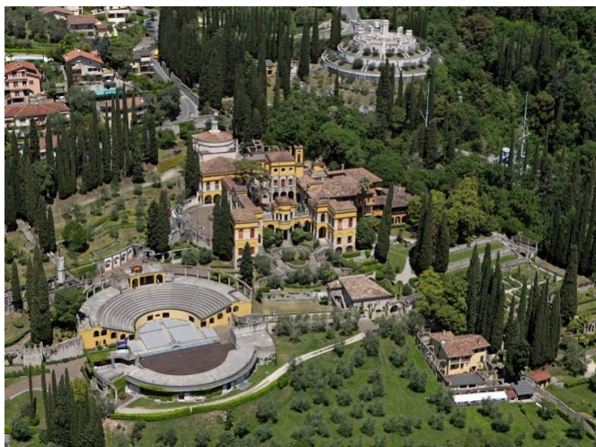
Vista del Vittoriale

Come prima uscita extrascolastica del nuovo anno, il 27 Gennaio noi classi quinte ci siamo recate con mezzi propri presso il noto Vittoriale degli italiani, la splendida residenza di Gabriele d'Annunzio nonché un simbolo d'orgoglio della nostra nazione.